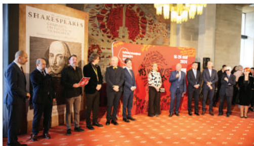
Deschiderea Festivalului, ediția a XIV-a, 2024

Lume-i o scenă și toți oamenii actori , ediția a VIII-a din 2012, a inclus câteva dintre cele mai importante companii teatrale între care