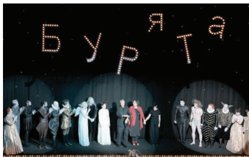
„Furtuna”, regie Robert Wilson, Teatrul Național „Ivan Vazov” din Bulgaria, 2024

Berliner Ensemble și Teatrul Shakespeare's Globe din Londra care a prezentat în deschidere spectacolul Sonetele lui Shakespeare realizat de regizorul american Robert Wilson. A urmat o producție inedită a piesei Visul unei nopți de vară susținută de o companie din Coreea de Sud cu adresabilitate tuturor categoriilor de spectatori. Naționalul craiovean a prezentat Furtuna în regia lui Silviu Purcărete, care a reprezentat a treia montare a piesei realizată de celebrul regizor. Mai trebuie amintit spectacolul cu Regele Lear susținut de Compania „Scene en vie” din Grenoble, Franța.